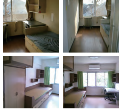
上段2枚がタイプ1、下段2枚がタイプ2の部屋です。